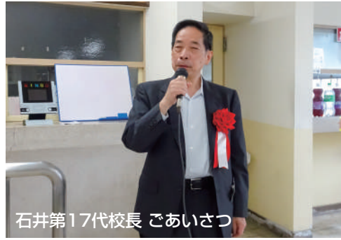
石井第17代校長 ごあいさつ

卒 業生の方の住商を想う気持ちが伝わりました。これからも住商に入学される方が増えて、さらに賑やかな懇親会のなるように願います。お弁当も美味しかったです。