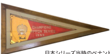
日本シリーズ当時のペナント