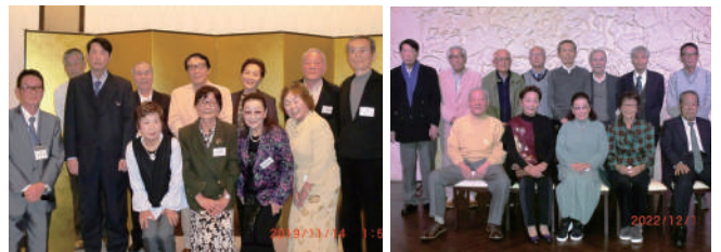
毎年のクラス会の写真蔵出し

今回は、二〇二五(令和七)年一〇月二十三日に、G組のクラス会を大阪市港区にあるアートホテル大阪「割烹みなど」で開催し、男性十一名、女性四名の計十五名が集まりました。ここ数年は毎年やっています。皆さん慣れたもので気楽に楽しく参加されています。今年は母校の同窓会の懇親会で、学年同窓会として参加します。