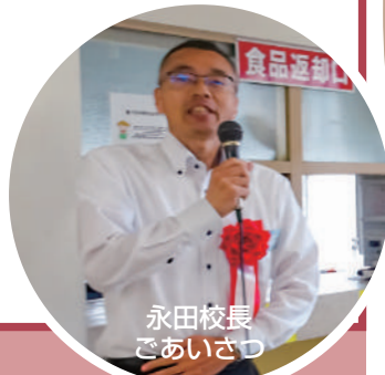
永田校長 ごあいさつ

引き続き令和7年度事業計画・予算の趣旨説明・提案を行い、すべて承認され、総会は成功裡に終了しました。