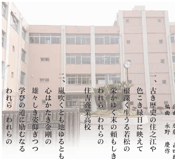
住吉商業高等学校校歌

住吉商業高校 一、古き歴史の住之江や 色こき緑日に映えて 根深く生うる若松の 栄かゆく木の頼もしき われら われらの 住吉商業高校 二、嵐吹くとも地ゆるとも 心はかたき金剛の 雄々しき姿仰ぎつつ 学びの道に励むなる われら われらの 住吉商業高校 三、流れ豊かに大和川 鏡の如き水の面 汚れに染まぬ若き日の 尽せぬ命たえつつ われら われらの 住吉商業高校 四、平和日本の動脈と 名に負う都大阪の 運命を荷う若人の 行手を照らすともしびは われら われらの 住吉商業高校