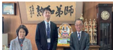
※追記、昨年「ミニミニ交友録」

勇気を出して前進、何があっても明るく、そしてすべての人々に真心で接して参ります。本年、84周年を迎える伝統ある住商の同窓生の一員として、在校生のため、同窓生のため、一生懸命尽力いたします。どうぞ宜しくお願い申し上げます。