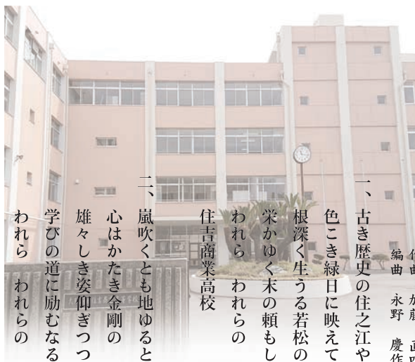
住吉商業高等学校校歌

住吉商業高校 一、古き歴史の住之江や 色こき緑日に映えて 根深く生うる若松の 栄かゆく木の頼もしき われら われらの 住吉商業高校 二、嵐吹くとも地ゆるとも 心はかたき金剛の 雄々しき姿仰ぎつつ 学びの道に励むなる われら われらの 住吉商業高校 三、流れ豊かに大和川 鏡の如き水の面 汚れに染まぬ若き日の 尽せぬ命たえつつ われら われらの 住吉商業高校 四、平和日本の動脈と 名に負う都大阪の 運命を荷う若人の 行手を照らすともしびは われら われらの 住吉商業高校