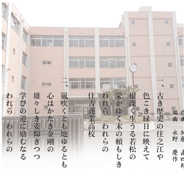
住吉商業高等学校校歌

作詞 平林 治徳 作曲 加藤 直四郎 編曲 永野 慶作 一、古き歴史の住之江や 色こき緑日に映えて 根深く生うる若松の 栄かゆく木の頼もしき われら われらの 住吉商業高校