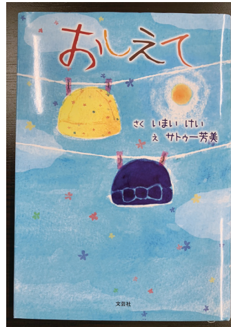
絵本「おしえて」のカバー

「おしえて」と不安に思っているのでしょう。子どもは一生懸命に考えても分らぬ事がいっぱい。不安で仕方がない。ネエ『おしえて』と叫んでいる様に私には聞こえている。私が通院している病院では看護師さんが、がんと診断された母子にこの絵本を読みかかせをし、お母さん達は手術や治療に前向きになったと喜んでいたり話をしてくれました。友人達は職場や子育てで支援で読んでくれたり、英訳もしてくれました。一人でも多くの人達に読んでもらえ温かい気持ちに嬉しい。絵本の最終章にお母さんがおんが治ってほしい。きつと治ると希望を込めて書き終えた。