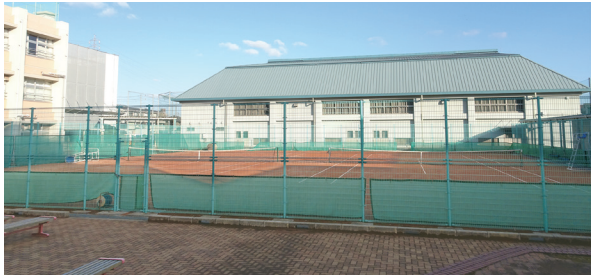
テニスコート、バックは体育館