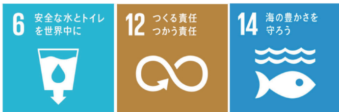
引用：SDGsの17の目標のうち住商が取り組む3項目

この取り組みが、住吉商業高等学校の今後の発展につながると考え、今回は給水機の設置についての要請をさせていただきました。