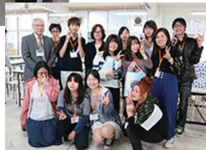
皆さんありがとうございました