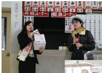
◀ビンゴゲームの様子