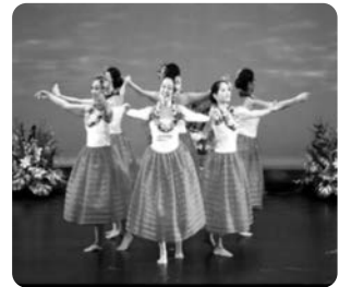
右から二人目が私

住商を卒業し、ブリヂストンタイヤ(株)に就職しましたが結婚のため3年足らずで退社。主人の両親自営のパン・たばこ小売店を手伝うために同居しました。義父は70歳、義母は65歳と、高齢でしたので病院に通院されたり、入院されたりすることが多く、家事と育児しながら、朝6時半からのお店番は大変な日々もありました。義父は1年半入院の後、他界され、自宅介護していた義母は93歳に老衰で息を