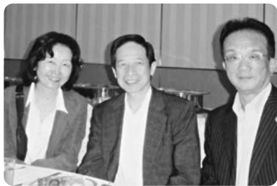
同窓会総会でのひとこま