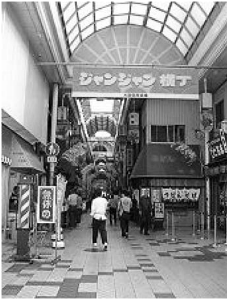
ジャンジャン横丁

前年の会報では、担当者の都合でお休みさせていただきました。今回は、百年前にタイムスリップ致します。