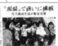
大阪日日新聞掲載