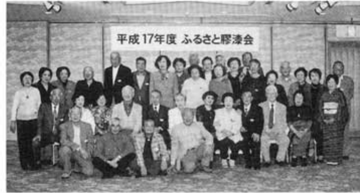
平成17年度 ふるさとと膠漆会

平成17年度のふるさとと膠漆会が今年も晴天の11月4日に、ホテル・アウイナ大阪で盛大に開催された。幸せに浸りながら、会場に着くと笑顔の友が迎えてくれて、早くも卒業55年の年を越えて今日又多くの学友いや戦後の日本を必死に生き抜いた戦友に今年も逢える嬉しさで胸に熱い思いが……。此の気持ちは皆同じだと、