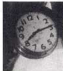
(投下時刻を指して止まった柱時計)

7月28日 鈴木首相、ポツダム宣言を黙殺、戦争継続との談話を発表。 8月6日 午前8時15分、広島に原爆。原爆による犠牲者20万人と推定される。犠牲者の中に学徒動員で赴いた住商生も含まれています。