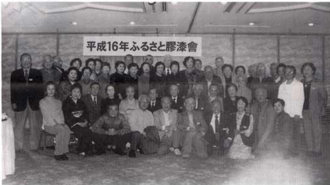
平成16年ふるさとと膠漆会