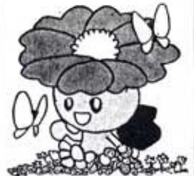
住之江区マスコットキャラクター「さざびー」です!!

住之江区御崎は、一九四七年（昭和49年）住吉区から分区され誕生しました。それ以前は住吉区南加賀屋でした。