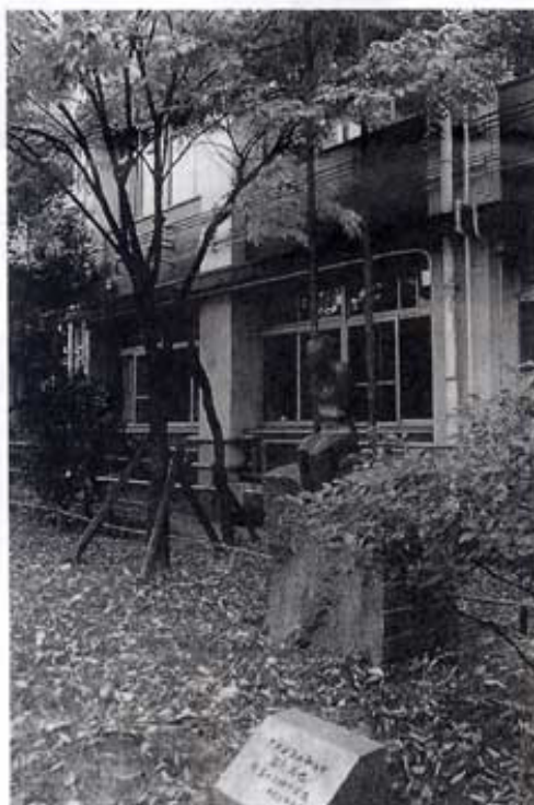
「ブランコの中の女」富長敦也氏作(母校中庭)